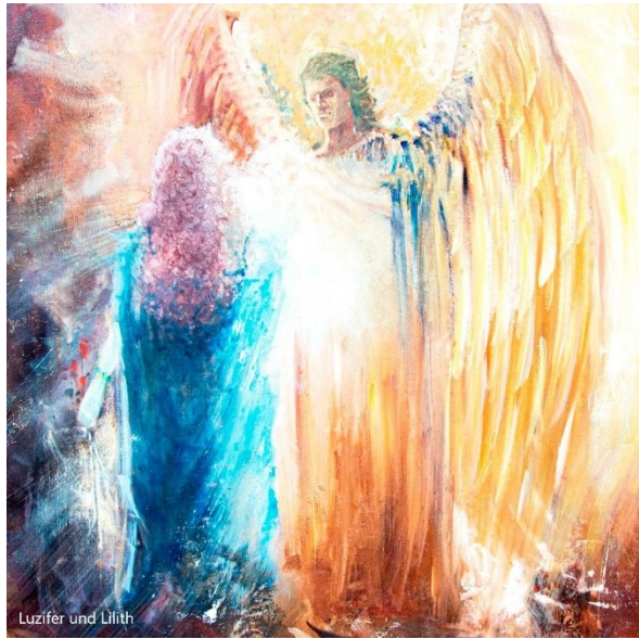
Luzifer und Lilith